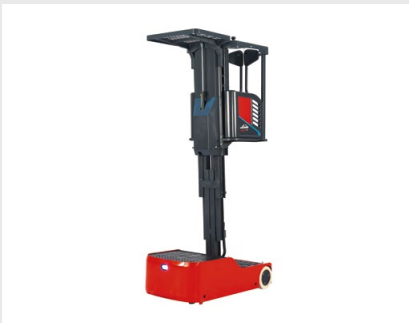
Optimiertes Kommissionieren auf der ersten und zweiten Ebene