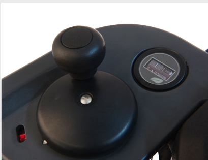
Alle Informationen auf einen Blick