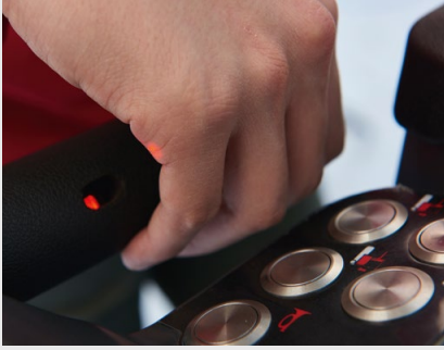
Sicherheitssensor am rechten Griff